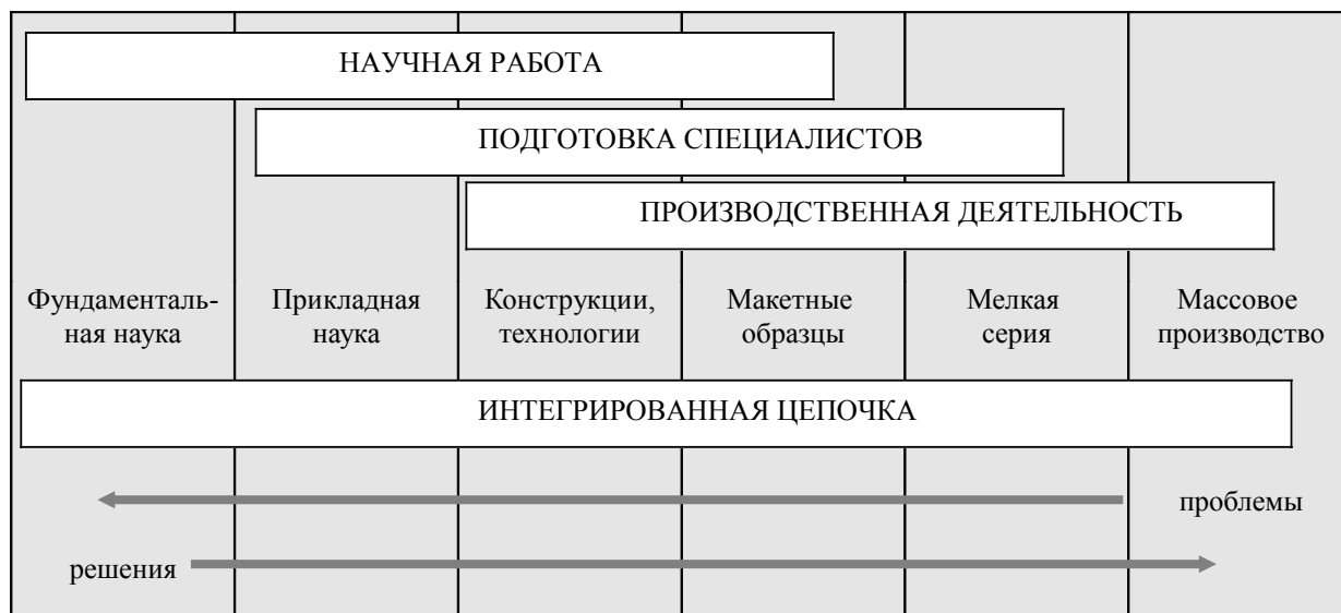
Рис. 2. Многослойная модель взаимодействия предприятия и университета

На рис. 2 представлена модель научной деятельности университета, в которой отражена связь с предприятиями и учебным процессом. В основе модели лежит разбиение всех видов работ на слои [2], обеспечивающие взаимодействие теоретических представлений с проблемами производства посредством интегрированной цепочки.